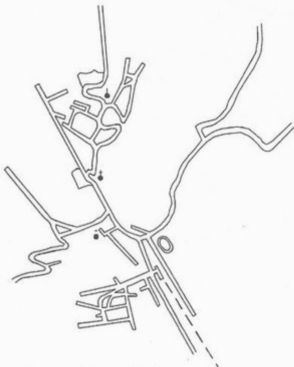
3. ábra. Rudabánya, 1999

számára szociopetális térré, az ugyanilyen formájú kolóniák a betelepült német bányász-, iparosrétegek számára szociofugális térré. Azok a mikrokulturális összetevők, amelyek az egyik helyen a közösséggé válást elősegítették, a másik helyen éppen ellentétes hatást fejtettek ki.