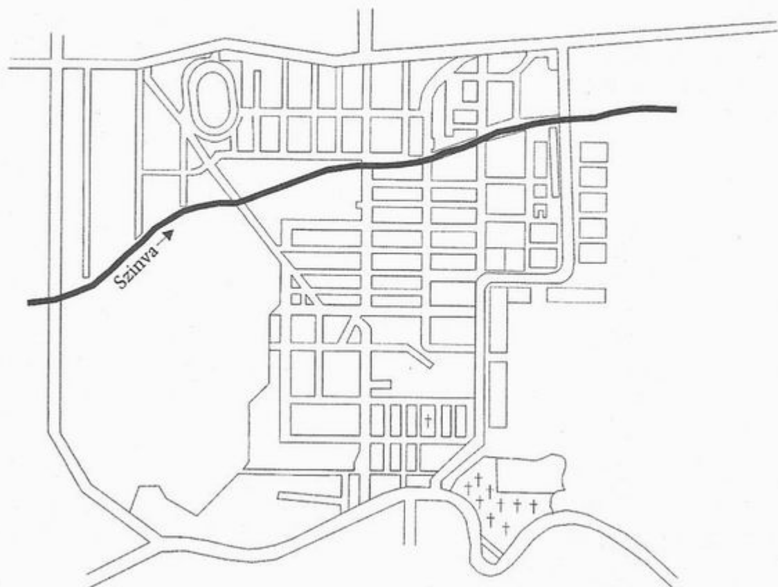
2. ábra. A diósgyőr-vasgyári kolónia, 1999

Alapvető különbségek fedezhetőek fel a két gyarmat tervezésének, illetve kivitelezésének a folyamatában is. Míg a vasgyári kolóniát egy homogén, nagyméretű, nagyjából vízszintes területen klasszikus hálózat formájú, jó-részt párhuzamos, egymást merőlegesen keresztező utcarendszerrel tervez-ték meg (2. ábra), addig a rudabányai kolónia, maximálisan követve az építkezést erősen determináló domborzati viszonyokat, kifejezetten hal-maztelepülés jelleggel bír (3. ábra). A külső szemlélő szemében a vasgyári kolónia kiegyensúlyozott, könnyen átlátható, szétválasztott és sorba ren-dezett térrészeivel szemben a rudabányai kolónia ötletszerűnek, rendetlennek és rendezetlennek tűnik.